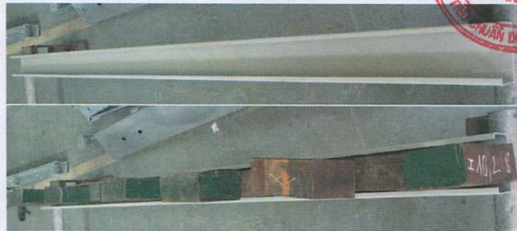
Máng cáp: W100xH50xT2,0xL2500